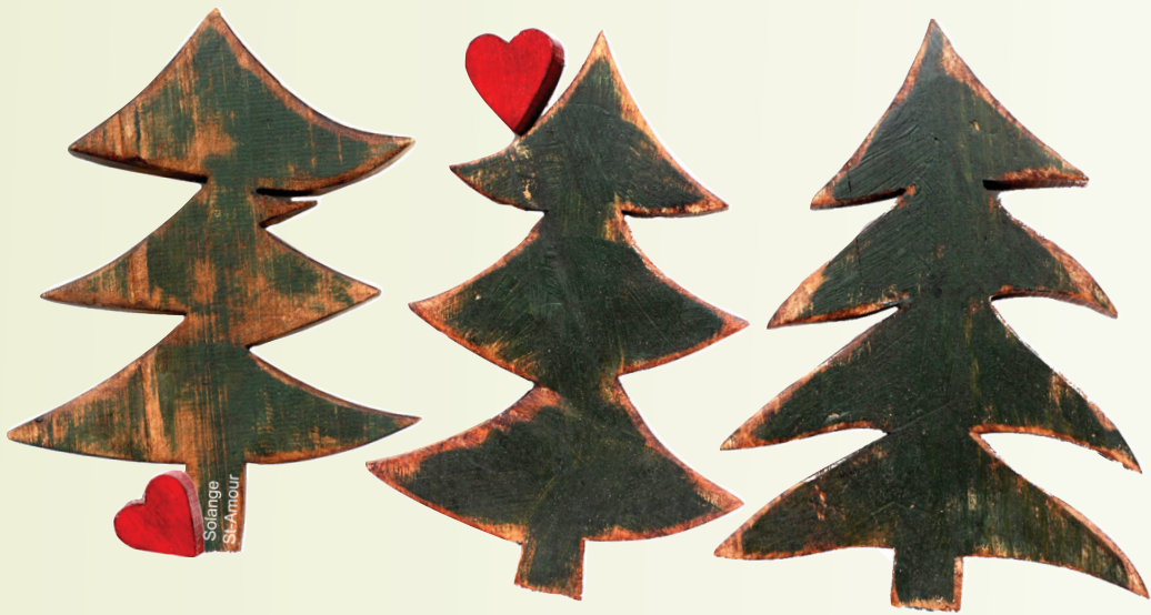
Création Solange St-Amour

En ce précieux temps des Fêtes, je me permets, au nom du conseil municipal, de souhaiter que l'harmonie, l'allégresse et l'amour soient au centre de vos rencontres.