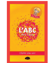
L'ABC des filles Catherine Girard- Audet