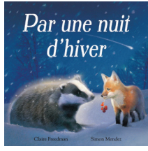
Par une nuit d'hiver Claire Freedman/ Simon Mendez